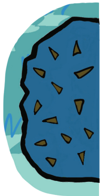
Rabat-buisson à scotcher page 10