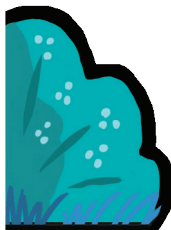
Pochette-buisson à scotcher page 10 pour ranger Lili Souris