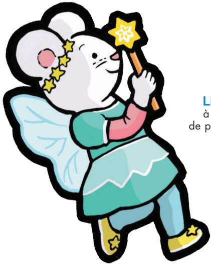
Lili Souris à promener de page en page