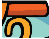
Pochette-carrosse à scotcher page 12