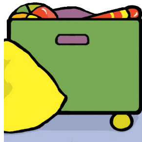
Pochette-coffre à scotcher page 13