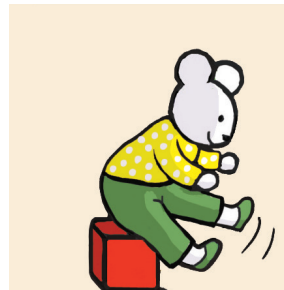
Doudou à scotcher page 13